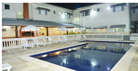
PRAIA GRANDE 02